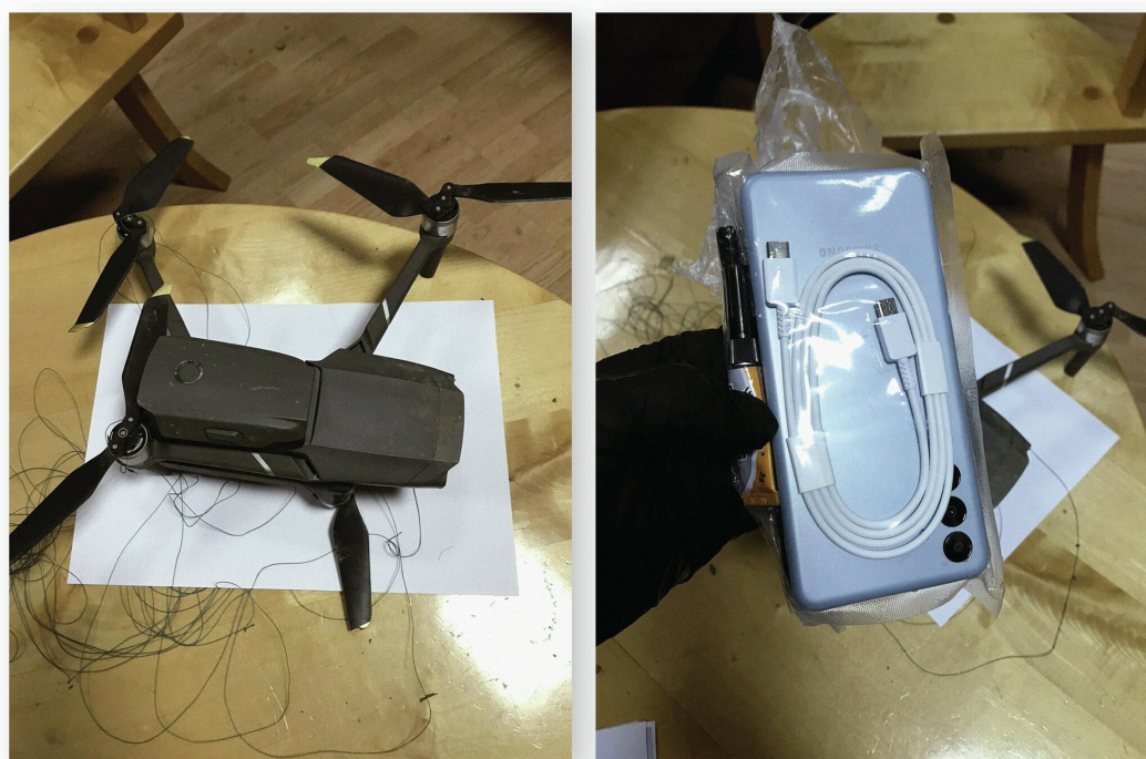
Një dron i pajisur me dy telefona celularë u zbulua në burgun në Spuzh, Mali i Zi.

Serbia nuk është i vetmi vend në rajon që po përballet me vështirësitë e komunikimeve të paligjshme nga brenda burgjeve. Në shtator të vitit 2023, një burgun e Spuzhit, në Mal të Zi, u gjet një grumbull telefonash dhe karikuesish të fshehur. 19 Në korrik të vitit 2023, brenda një kondicioneri u gjetën gjashtë celularë të fshehur. 20 Në janar të vitit 2023, u zbulua një dron, që