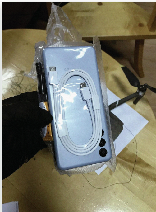
Дрон опремен со два мобилни телефона забележан во Спуж Затвор, Црна Гора