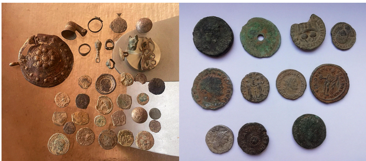
Предмети од културно наследство заплени во полициски рации во Северна Македонија.

Во 2021 година, јавното обвинителство обвини осум лица за нелегален ископ на предмети од културното наследство. На обвинетите, кои биле фатени додека копале и вршеле неовластено истражување и ископување на регистрирани и нерегистрирани