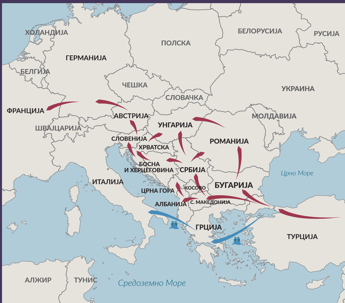
СЛИКА 1 Движење на децата мигранти низ регионот на Западен Балкан.