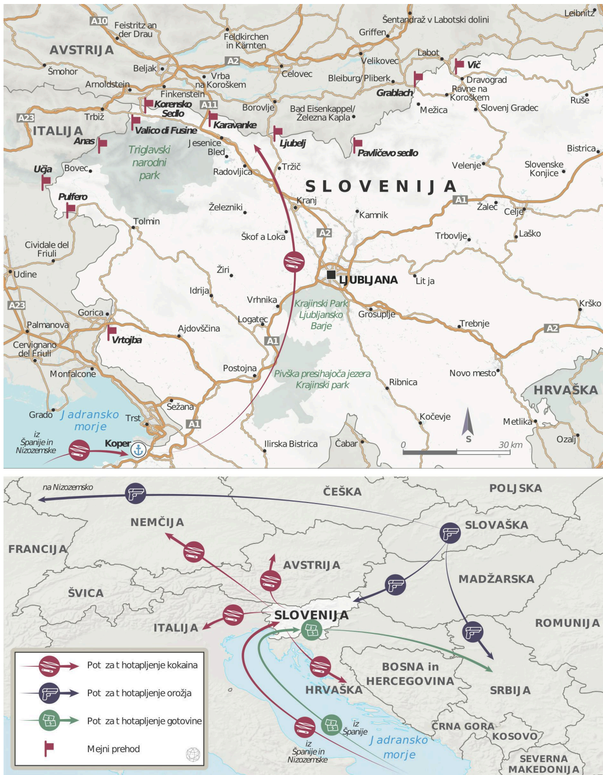
Slika 1 Tihotapske poti v in iz Slovenije.

postal policijski obveščevalec. Slednji naj bi trdil, da so srbski in črnogorski državljani, povezani s kavaškim klanom, ustanovili celico v Sloveniji ter nadzirali pretok mamil in denarja, zasluženega s prodajo. 9