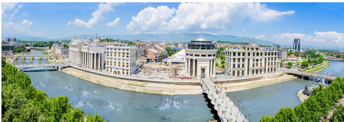
Pogled na Skoplje, Severna Makedonija.

Idući napred, konstatovano je da bi trebalo da postoji veća podrška istraživanjima o organizovanom kriminalu, veća podrška organizacijama civilnog društva van glavnog grada, jači fokus na obrazovanje (posebno za suzbijanje „kulture korupcije“), veći fokus na pitanja koja se tiču mladih i više istraživanja o pozitivnim i negativnim efektima digitalizacije, kao i veća saradnja organizacija civilnog društva, medija i akademske zajednice na razotkrivanju i rešavanju ekološkog kriminala. Pored toga, učesnici su razgovarali o tome kako ukazati na štetnosti organizovanog kriminala i korupcije, kao i kako razviti narative o promenama i promovisati pozitivne uzore za inspirisanje ljudi.