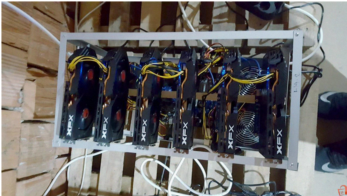
Oprema za rudarenje bitkoina na prodaju u Severnoj Makedoniji.

Zaključak je da je e-trgovina očigledno talas budućnosti. Iako je upotreba kriptovaluta na Zapadnom Balkanu trenutno ograničena i teško je izmeriti u kojoj meri se