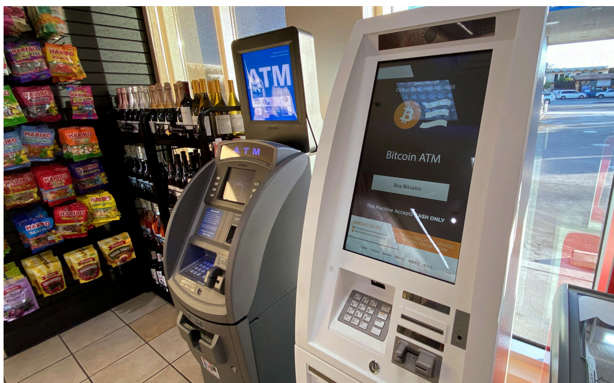
Bitkoin bankomat pored običnog bankomata na benzinskoj pumpi.

U zemljama sa slabom regulacijom ili sprovođenjem pravila „Upoznaj svog klijenta (KYC)“, bankomati mogu biti portal za pranje novca. Na primer, oni mogu da dozvole ljudima da kupe bitkoin preko kreditnih ili