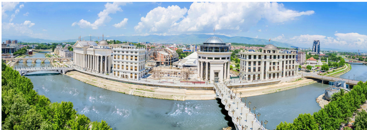
Поглед на Скопје, Северна Македонија.

Во продолжение, беше забележано дека треба да постои поголема поддршка за истражувањата на организираниот криминал, зголемена поддршка за