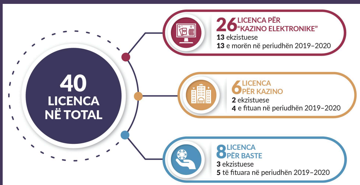
FIGURA 2 Numri i kompanive me licencë për të kryer aktivitete të lojërave të fatit në Maqedoninë e Veriut.