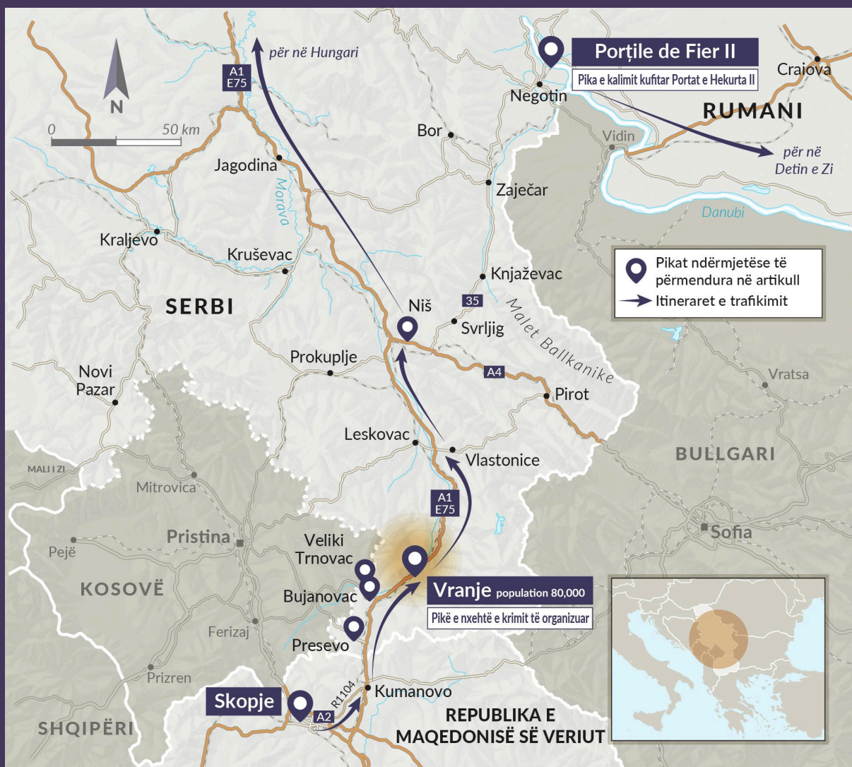
FIGURA 1 Vranja, në serbinë jugore, është një zonë e nxehtë për krimin e organizuar.

organizonte që një nga shoferët e kamionëve të përfshirë në dërgesën e kapur të kokainës të përmendur më sipër të zhvendosej nga Rumania në Serbi. 21 Prokurorët nga Vranja ngritën një aktakuzë kundër inspektorit të policisë në tetor 2019. 22 Gjykata e lartë në Vranja e shtyu paraburgimin e tij gjashtë herë; megjithatë, gjykata e apelit në Nish e liroi atë nga paraburgimi në dhjetor 2019. 23