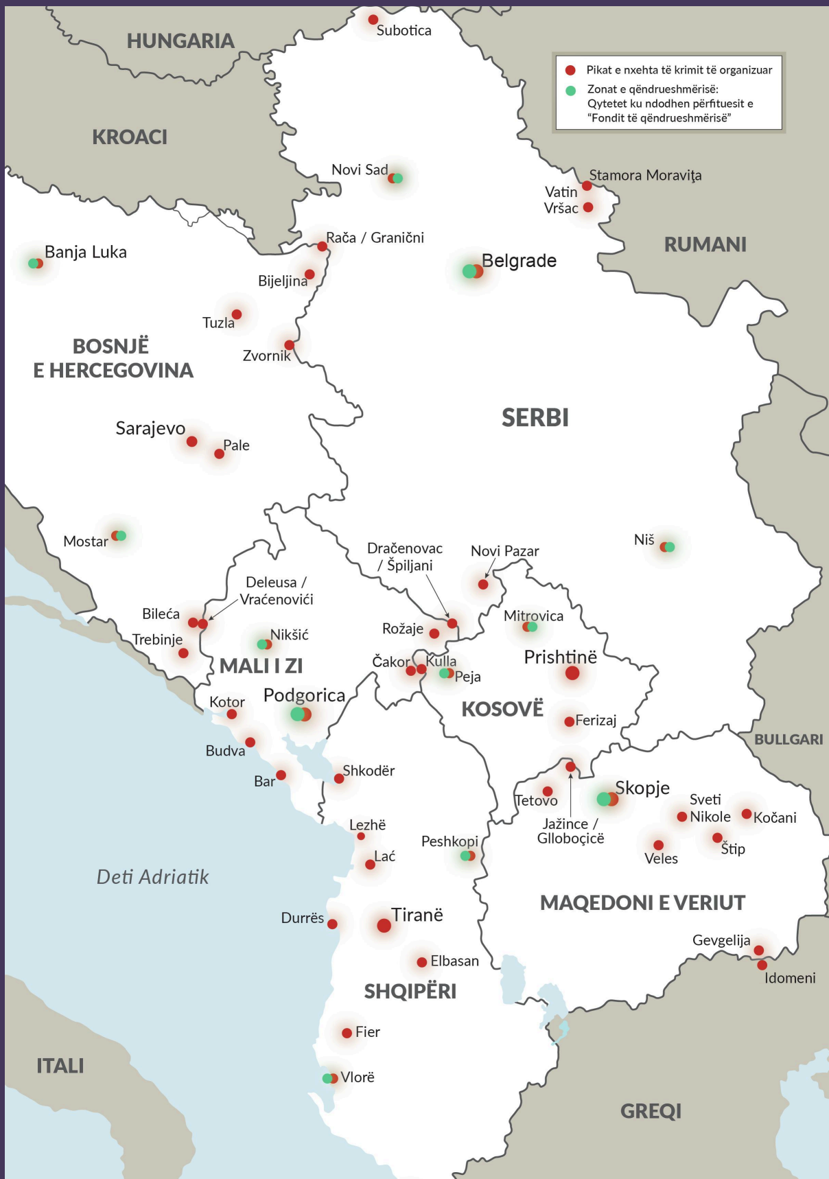
FIGURA 3 Pikat e nxehta të krimit të organizuar dhe vendet e qëndrueshmërisë nëpër Ballkanin Perëndimor.