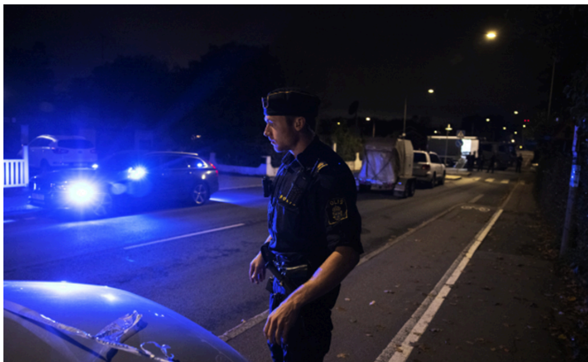
Шведски полицаец истражува место на злосторство.

Во 2014 година, операцијата „Рекил“ (анг. Operation Recoil) стана една од првите големи меѓународни истраги. Покрената е по откривањето на пет автоматски оружја и 59 рачни бомби во автомобил што патувал од Словенија до Шведска. 18 Апелгрен