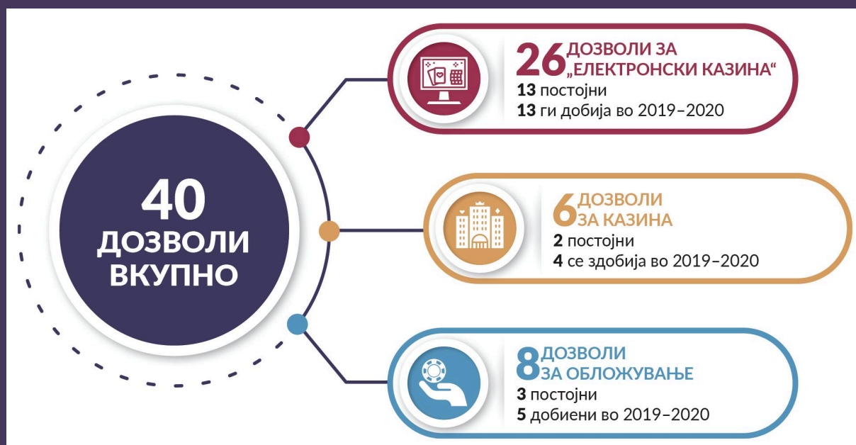
СЛИКА 2 Број на компании со дозволи за вршење коцкарски активности во Северна Македонија.