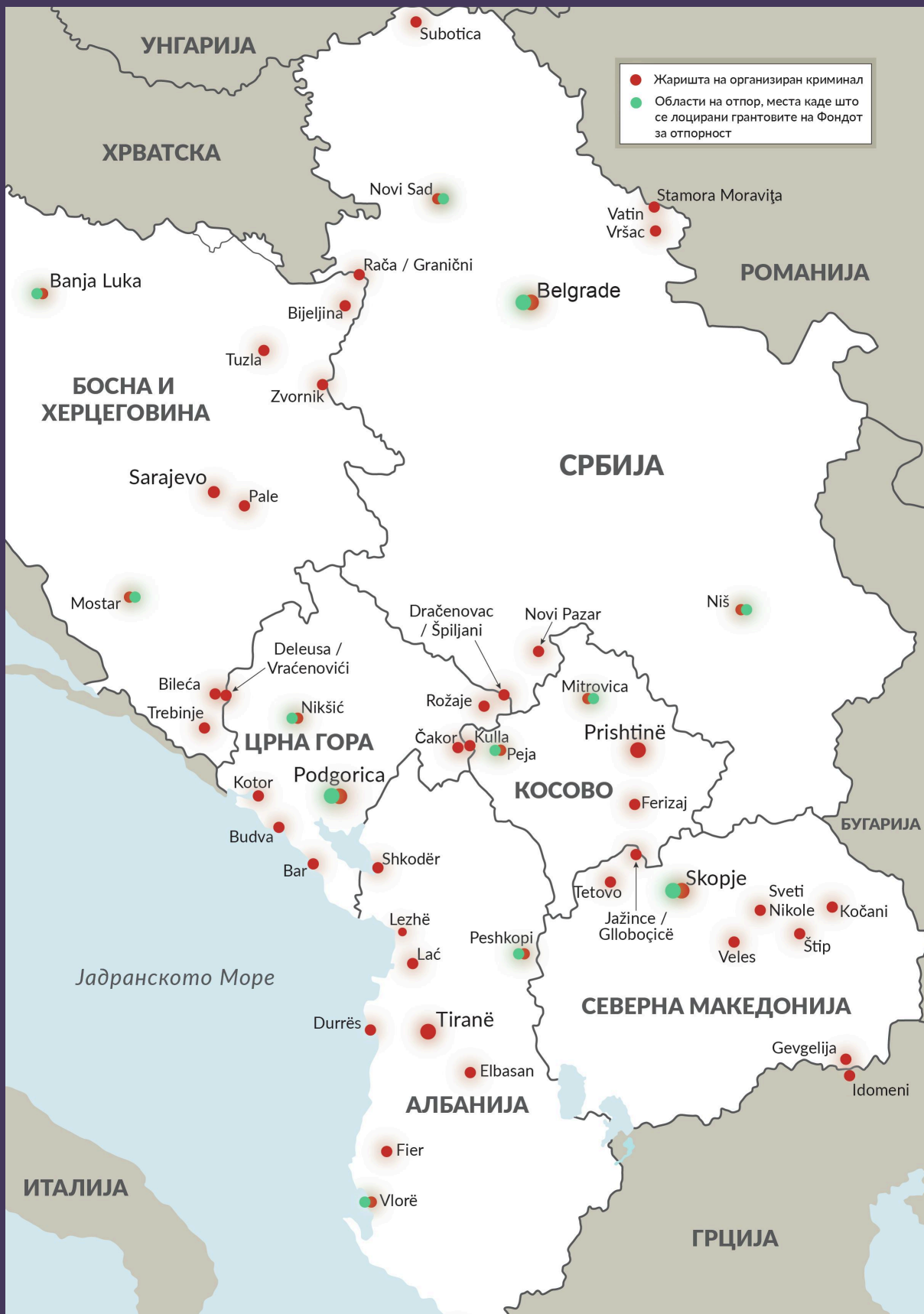
СЛИКА 3 Жаришта на организиран криминал и места на отпорност низ Западен Балкан.