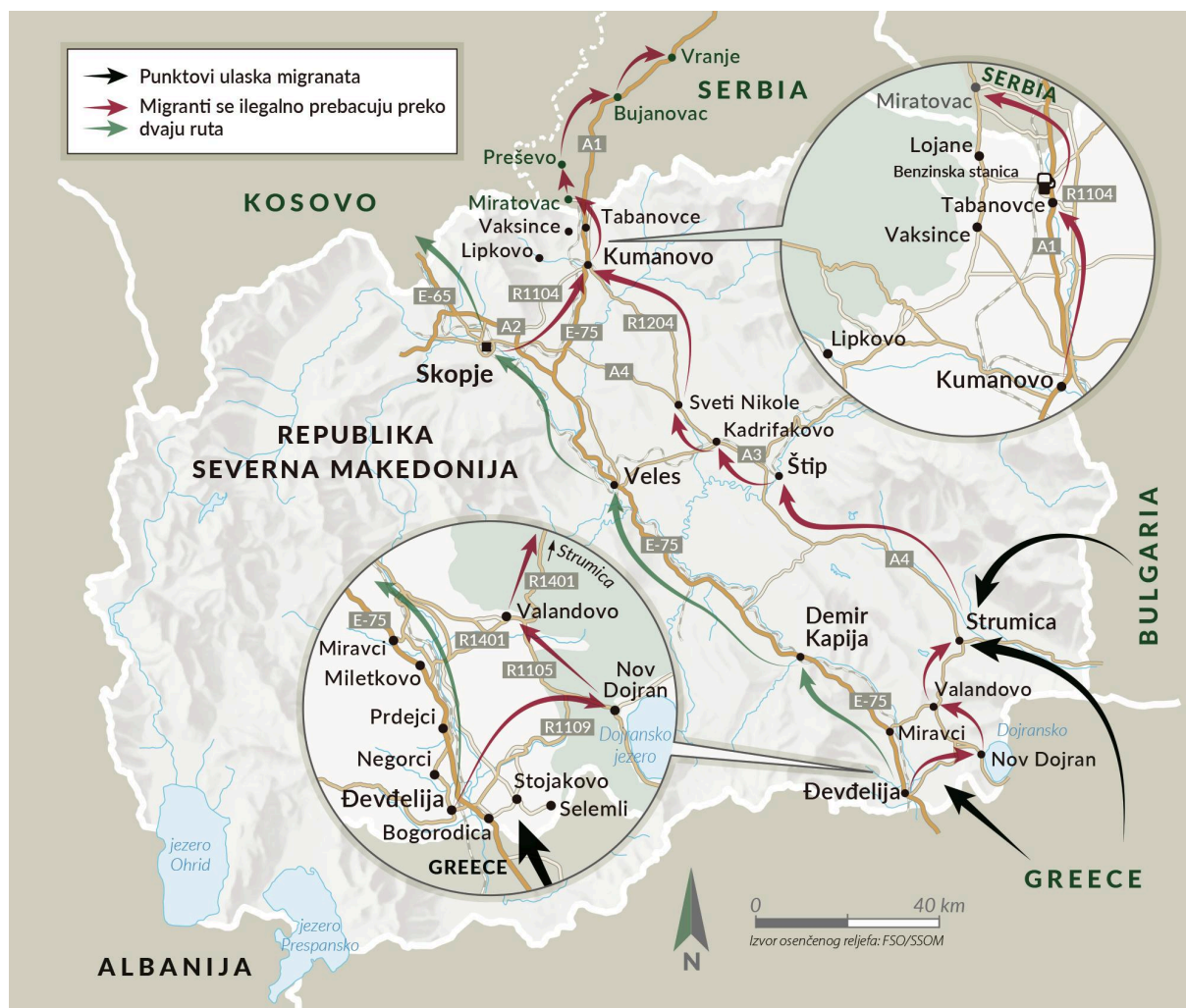
SLIKA 2 Ulazna mesta za migrante i putevi krijumčarenja preko Severne Makedonije.

Nakon što su prešli u Severnu Makedoniju, migranti kreću na sever Koridorom 10 od Đevdelije preko Velesa do glavnog grada Skoplja. Poboljšanje autoputa između Demir Kapije i Smokvice povećalo je brzinu saobraćaja i smanjilo broj kontrola, olakšavajući time krijumčarenje migranata. Alternativni put koji krijumčari koriste da bi izbegli policijske patrole prolazi od Đevdelije do Kumanova preko Bogdanaca, Valandova, Strumice i Štipa.