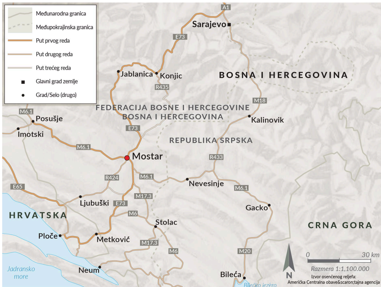
SLIKA 4 Mostar se nalazi duž ključnih krijumčarskih ruta.