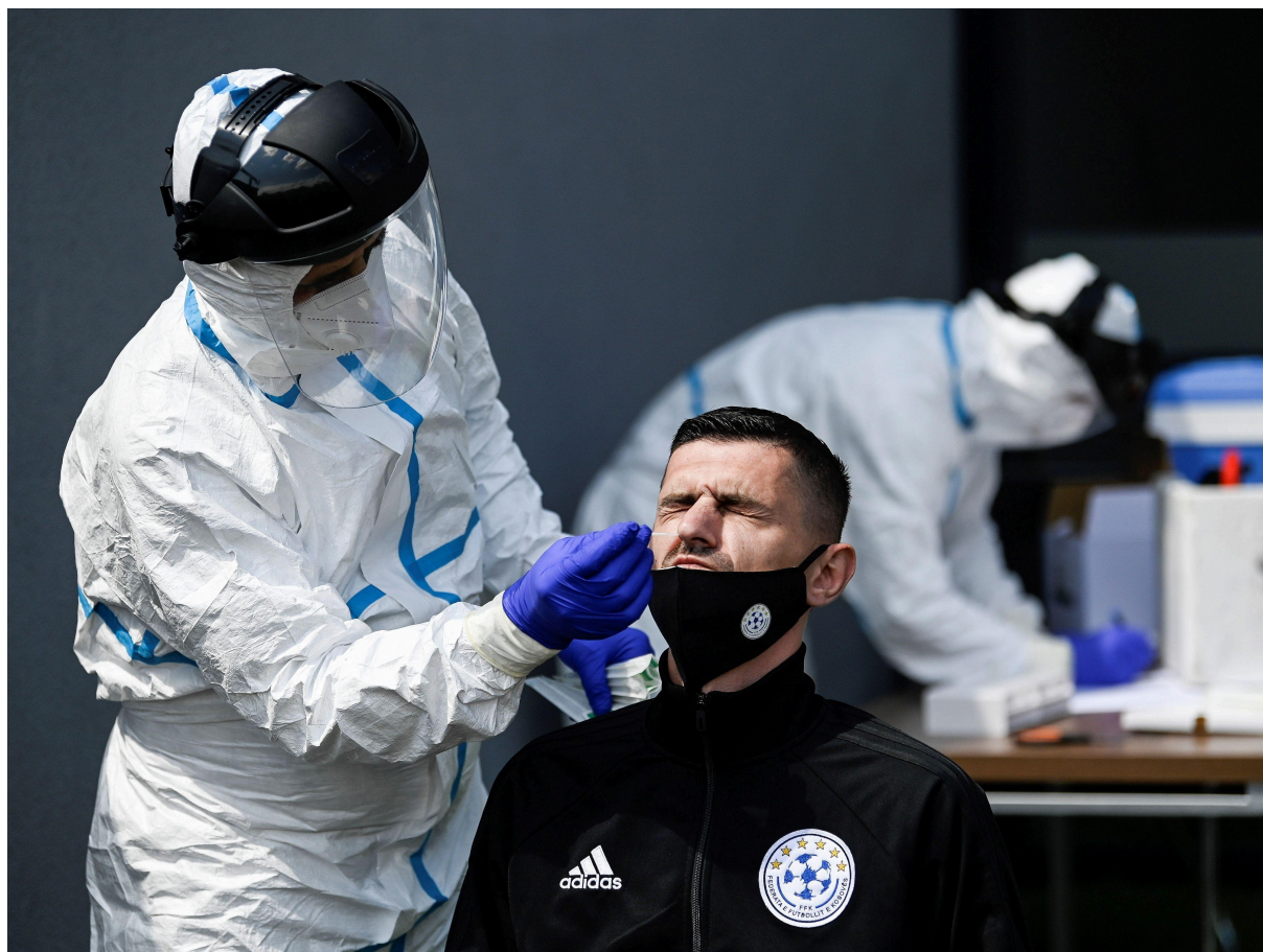
Fudbalski sudija se testira na COVID-19 u Prištini na Kosovu.

Kao i u drugim delovima sveta, potrošači na Zapadnom Balkanu su žrtve prevaranata koji prodaju falsifikovane lekove i maske, posebno onlajn – a taj rizik bi mogao da se poveća kada vakcina postane dostupna. Takođe postoji bojazan da bi kriminalci mogli da zloupotrebe državne