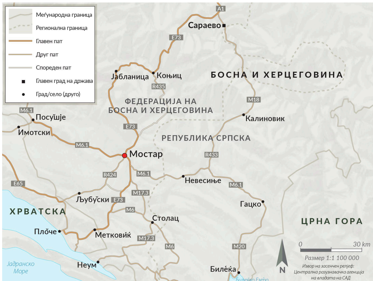
СЛИКА 4 Мостар се наоѓа долж клучните рути за трговија.

потенцијални чинители за промена коишто можат да ја зајакнат отпорноста во своите мрежи и заедници. Мораме да ги едуцираме и поттикнеме младите луѓе да се вклучат во активизам, да ги вклучиме во нашите активности и да ги поддржуваме и нивните идеи со цел да допреме до другите млади луѓе. Бидејќи нашиот образовен систем е слаб и поделен, неформалното образование мора да се засили и да ја пополни празнината.