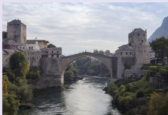
Поглед на мостарскиот мост преку реката Неретва. Покрај тоа што стана популарна туристичка дестинација, Мостар стана и жариште за организиран криминал.

На пример, во 2019 година, околу 5.000 работници од фабриката „Алуминиј“, економски гигант во овој регион, останаа без работа. Другите работници потоа штрајкуваа за да ги истакнат обвинувањата за корупција и лошото управување во фабриката. Обвинителството на кантонот покрена случај, но оттогаш ништо не се случи. Нешто слично се случи и со фабриката „Соко“, којашто порано беше голем производител на делови за воздухопловната индустрија. Лидерот на една од националистичките партии беше директор на фабриката кога таа банкротираше по приватизацијата. Меѓутоа, материјалните докази и сите обвинителни