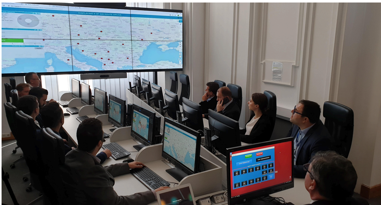
Единицата за Оперативен центар на СЕЛЕК во акција.

Да, надополнувајќи ја работата на полицијата и царината, Советодавната група на обвинители на Југоисточна Европа (СЕЕПАГ) работи под покровителство на СЕЛЕК од 2003 година. Мисијата на СЕЕПАГ е да ја олесни судската соработка во значајни транснационални кривични истраги и случаи. Создавајќи мрежа од искусни обвинители, СЕЕПАГ се обидува да ја пополни критичната