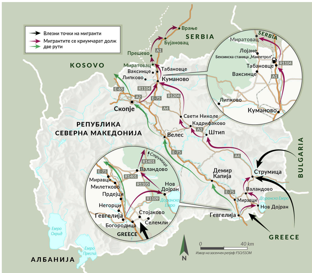
СЛИКА 2 Влезни точки за мигранти и рути на криумчарење преку Северна Македонија.

обезбедување лажни документи и информации за контактните точки во земјите долж рутата.