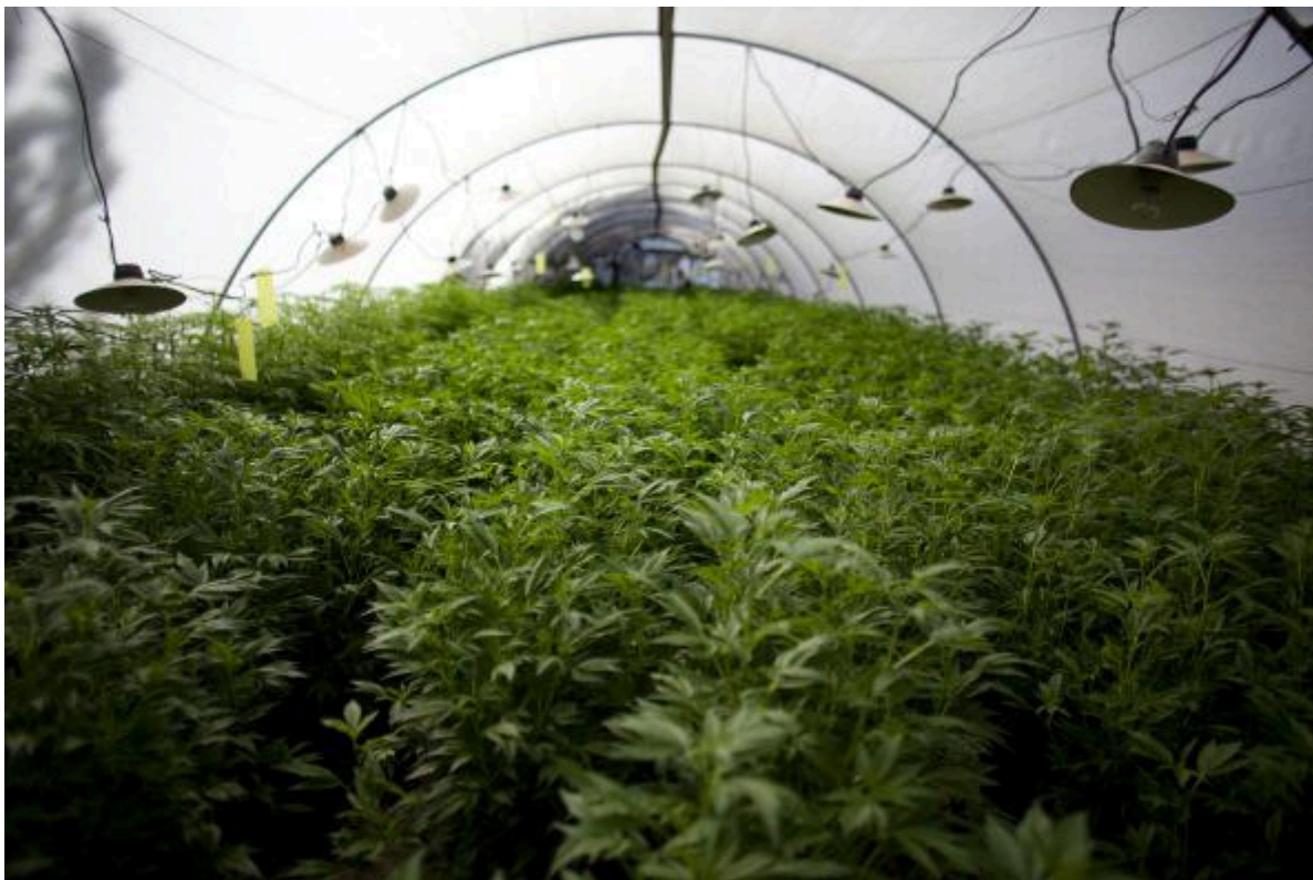
Uzgoj kanabisa u zatvorenom.

Iako Albanija i dalje važi za najvećeg evropskog proizvođača kanabisa, 7 izgleda da u današnje vreme neke kriminalne grupe preusmeravaju svoje aktivnosti na Zapadnu Evropu, gde je potražnja veća, ali je i rizik manji. Tokom poslednje četiri godine, izgleda da prevladuje trend – o čemu svedoče policijske aktivnosti u Zapadnoj Evropi – da preduzetnički nastrojeni albanski kriminalci ulažu u uzgoj kanabisa u zatvorenom prostoru u zemljama poput Španije, Holandije, Belgije i Velike Britanije. Tržišna dinamika koje stoji u pozadini ove promene su povoljne – potražnja u Zapadnoj Evropi je velika, baš kao i zarada. Kilogram kanabisa koji se uzgaja u zatvorenom prostoru u nekoj zapadnoevropskoj zemlji prodaje se za oko 3 000 evra. To je otprilike za trećinu više od onog što se u Zapadnoj Evropi zaradi od uzgajanja albanskog kanabisa. Kada se na to dodaju i troškovi i rizici trgovine drogom iz Albanije, jasne su prednosti izmeštanja proizvodnje bliže krajnjem tržištu.