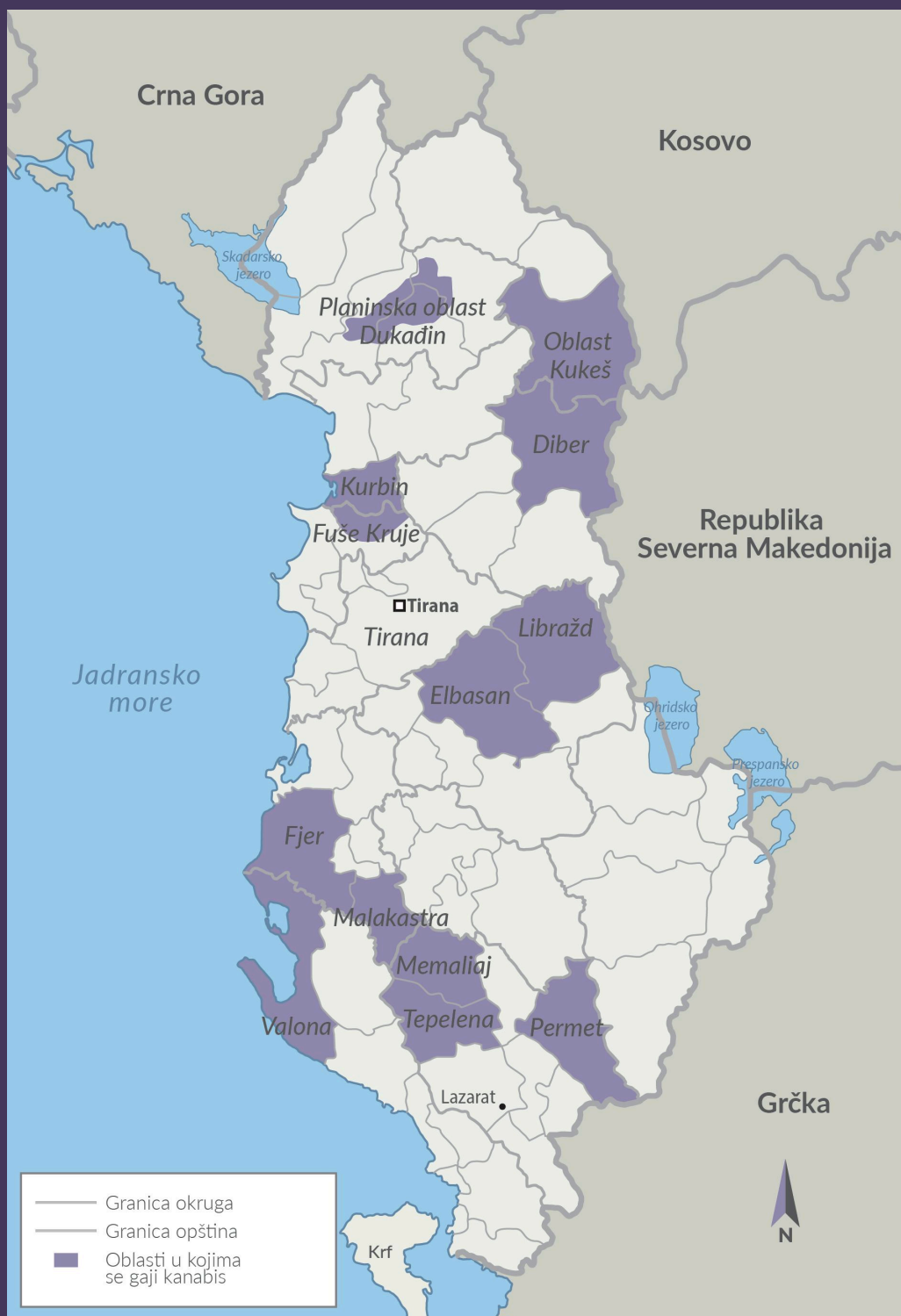
SLIKA 2 Oblasti u Albanije gde se uzgaja kanabis 2019. godine.