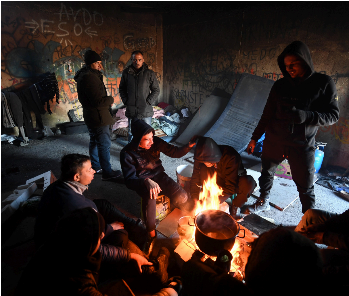
Tražiooci azila se greju u napuštenoj zgradi u kampu Bira u Bihaću.