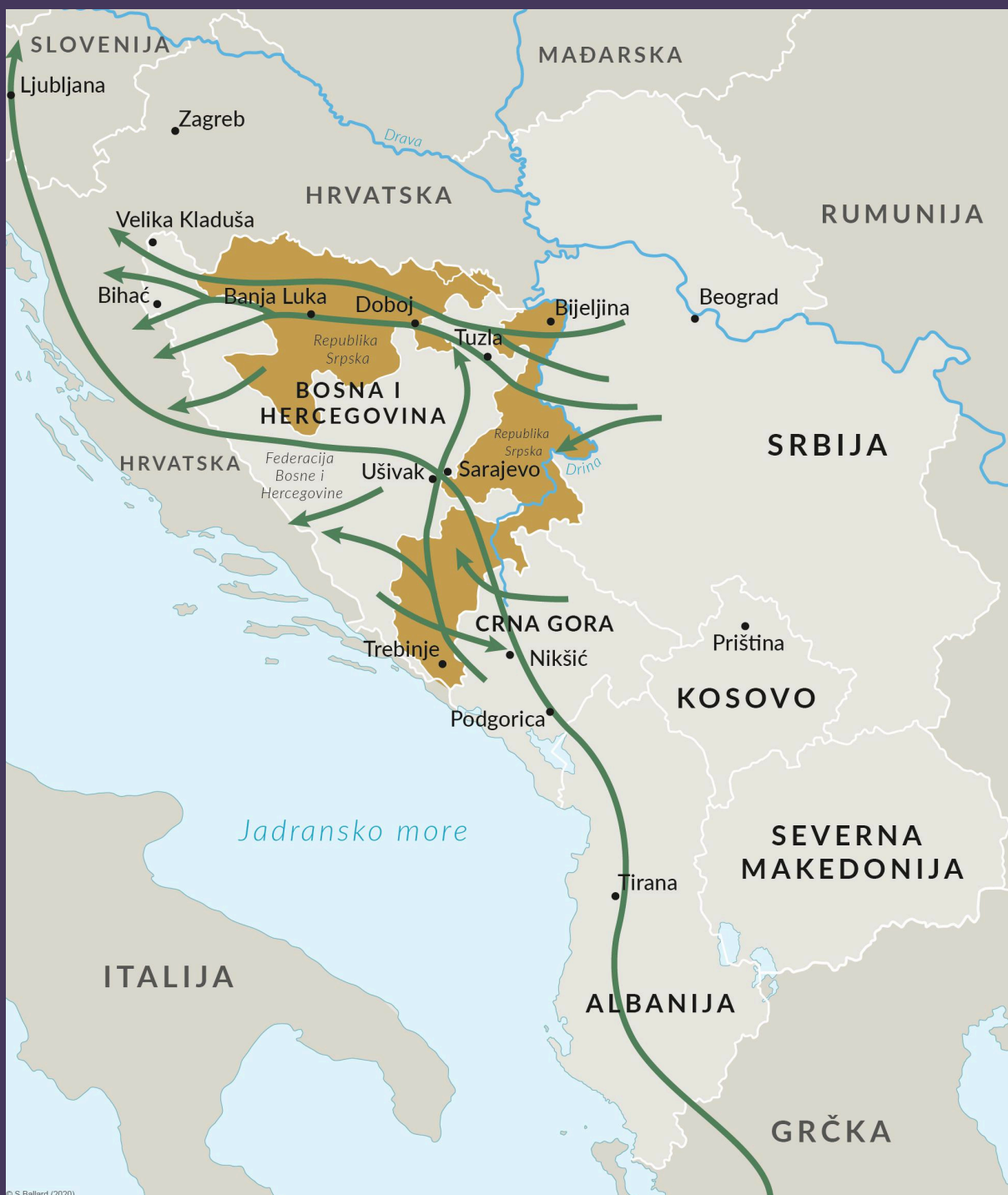
SLIKA 4 Glavna ruta za krijumčarenje migranata na Zapadnom Balkanu.