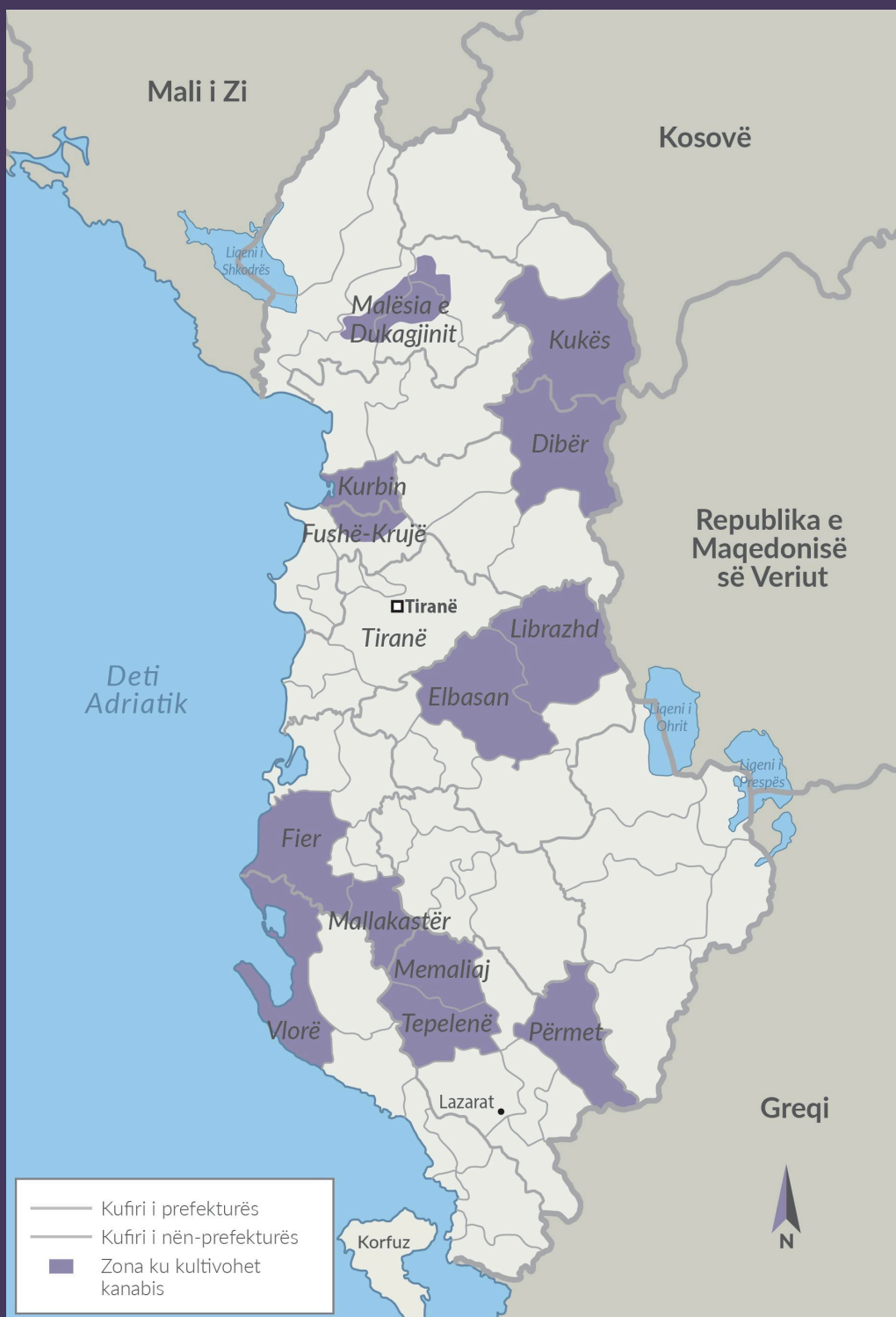
FIGURA 2 Zona të kultivimit të kanabisit në Shqipëri në vitin 2019.