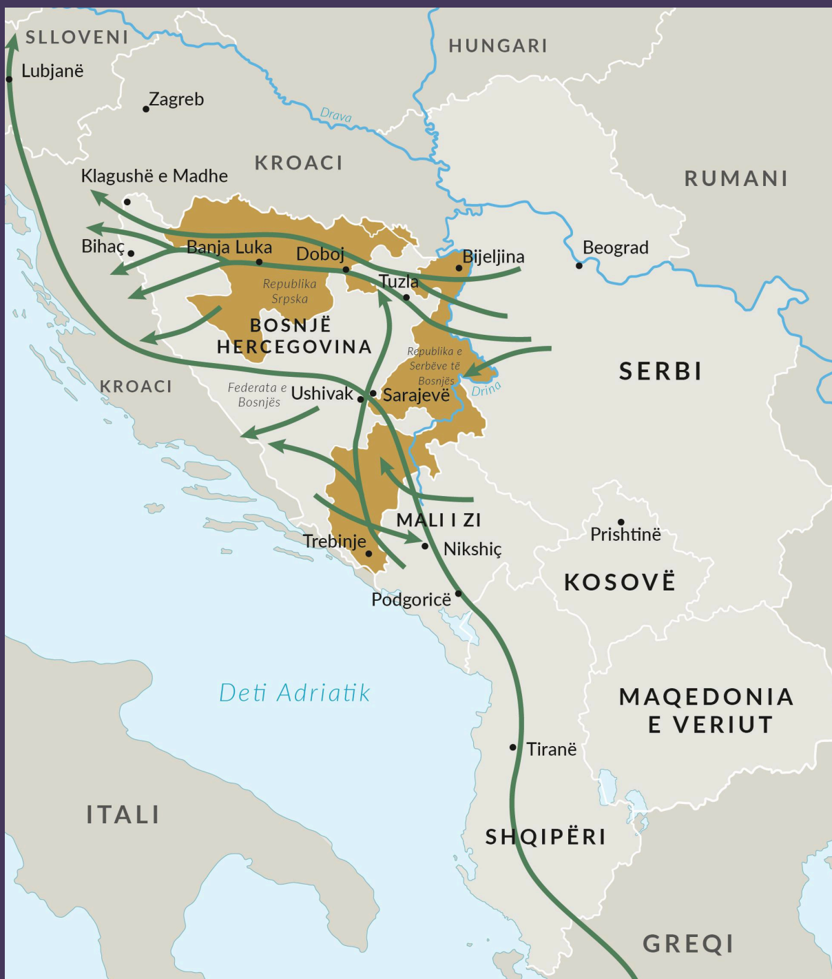
FIGURA 4 Korridoret kryesore për trafikimin e emigrantëve në Ballkanin perëndimor.