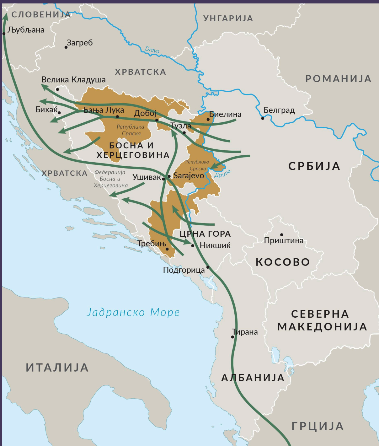
СЛИКА 4 Главни рути за шверц на мигранти на Западен Балкан.