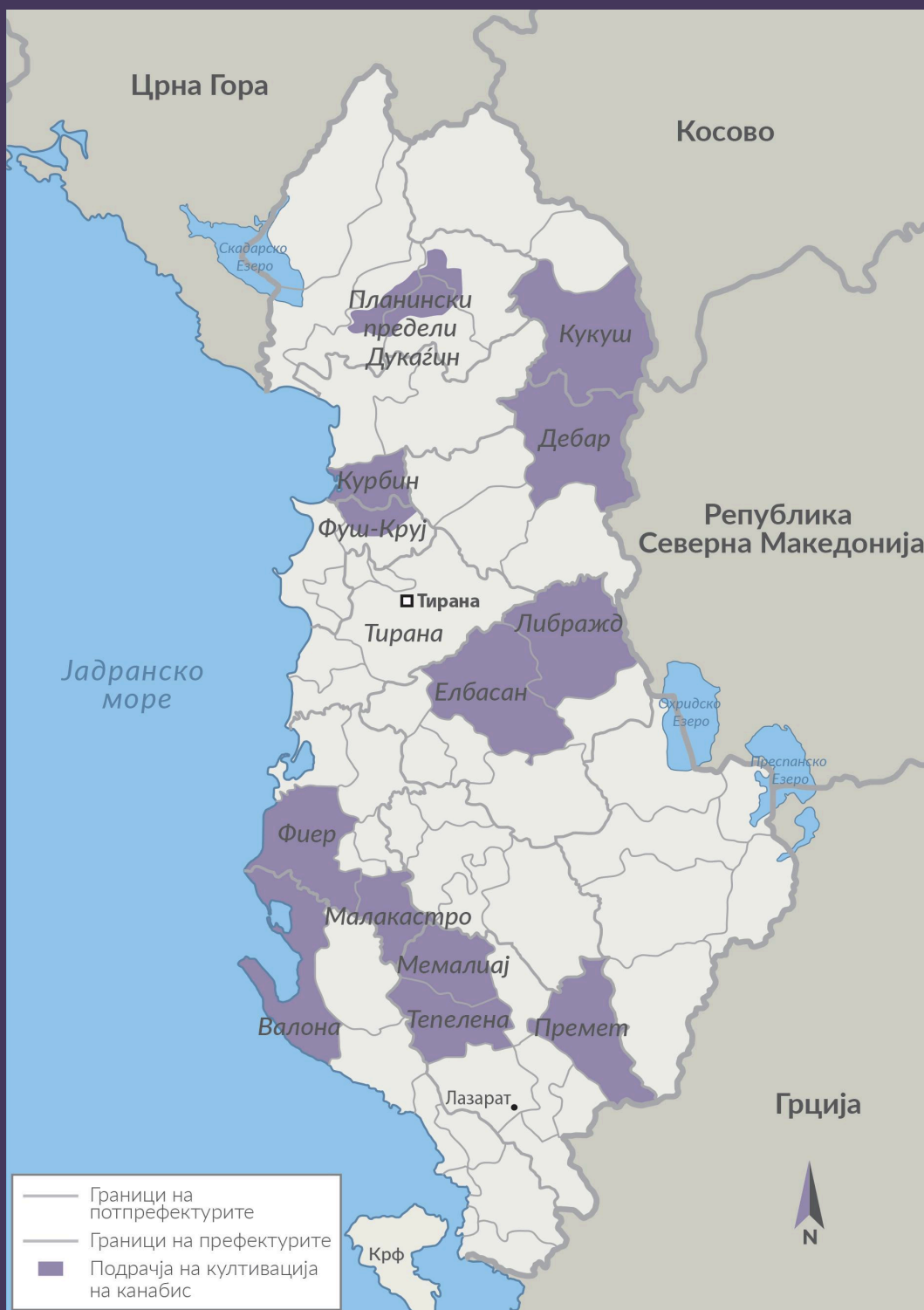
СЛИКА 2 Подрачја на одгледување канабис во Албанија во 2019 година.